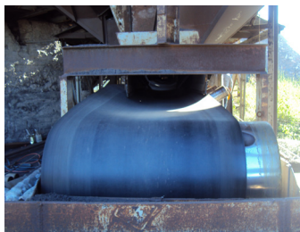
Преди инсталацията на Tru-Trac