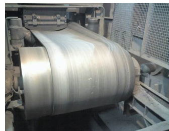
Преди инсталацията на Tru-Trac

Tru-Trac е уникална и патентована система за центриране, която се състои от компоненти и материали от най-високо качество. Представянето беше предложено от интензивен период на тестване и по-нататъшни подобрения. Tru-Trac системата за центриране беше тествана на инсталации по целия свят. Tru-Trac центриращия тракер премина през много успешни тестове в САЩ, Канада, Африка и Европа.