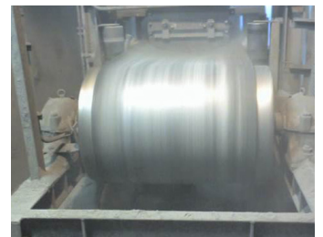
След инсталацията на Tru-Trac