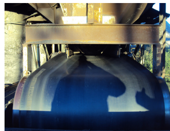
След инсталацията на Tru-Trac

Новата центрираща технология на Tru-Trac е достъпна за почти всички конвейерни широчини и има опция тя да бъде произведена спрямо изискванията на клиента. Tru-Trac центриращ тракер се доставя с повърхност от горещо вулканизиран каучук. Системата с два лагера гарантира максимално уплътнение. Няма друг центриращ тракер, който да може да се сравнява с Tru-Trac.